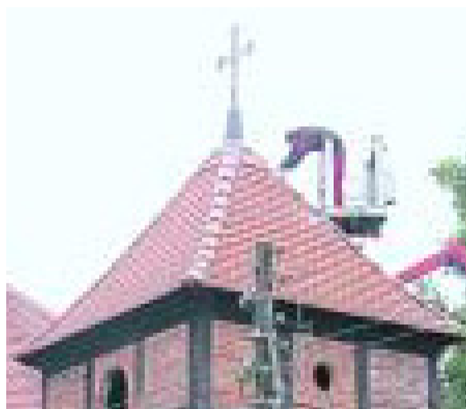
Gestern installierte die Elektrofirma Puhle den Blitzschutz am Turm.

Aufgaben geblieben, ebenso wie der Turm, in dem ein Radtouristen-Infopunkt untergebracht werden soll. Eine Karte könnte da hängen. Infotafeln sollen auf die Umgebung verweisen, nicht nur auf Schloss, Burgruine und Park, auch den Elefantenhof Plat-schow, die Angelteiche und den Skulpturenpark Pampin.