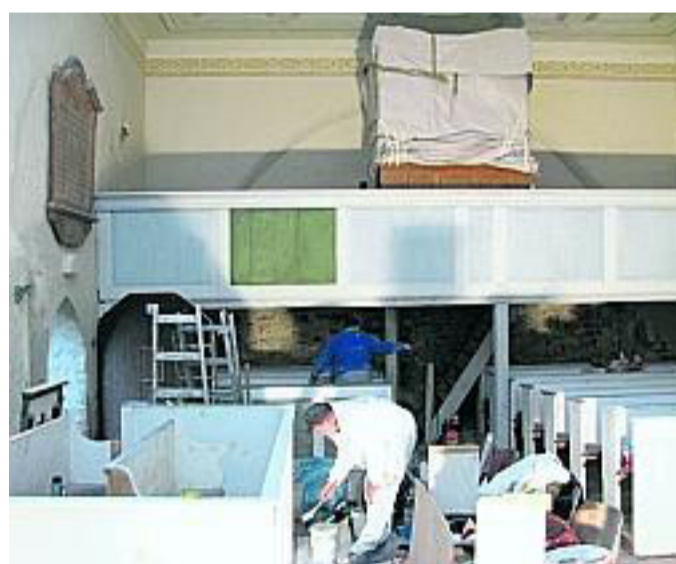
Der Malermeisterbetrieb Schlegel nahm sich auch des Gestühls an.