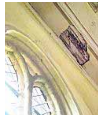
Der Putz bröckelt überall ab.